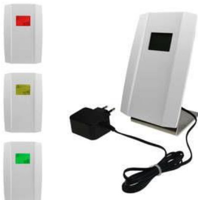
(Novos Move 5)

Abhilfe schaffen dabei sogenannte CO2-Fühler, die über einen integrierten Sensor kontinuierlich den CO2-Gehalt der Raumluft messen. Entsprechend den Empfehlungen der Innenraumlufthygiene-Kommission (IRK) des Umweltbundesamtes gilt eine ausreichende Qualität der Raumluft als gegeben, wenn der CO2-Gehalt im Raum nicht über einem Wert von 1000 ppm (CO2-Teilchen pro Millionen) liegt.