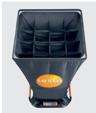
Strömungs-Gleichrichter für signifikant präzisere Messungen an Drallauslässen.