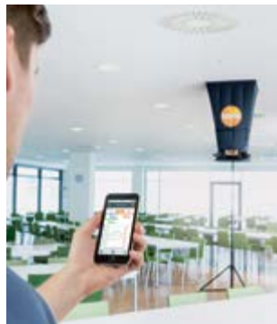
App-Anbindung über Bluetooth für Anzeige der Messdaten auf Mobilgeräten und Finalisierung des Messprotokolls vor Ort.