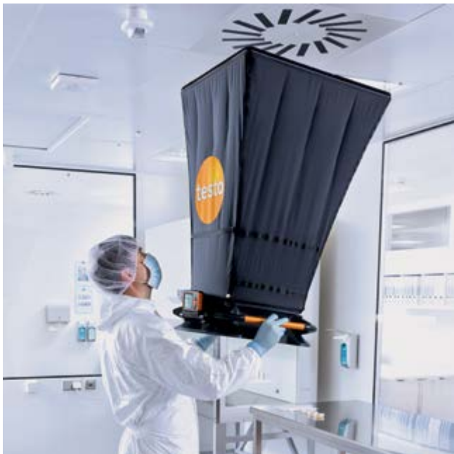
Komfortabel messen dank geringem Gewicht