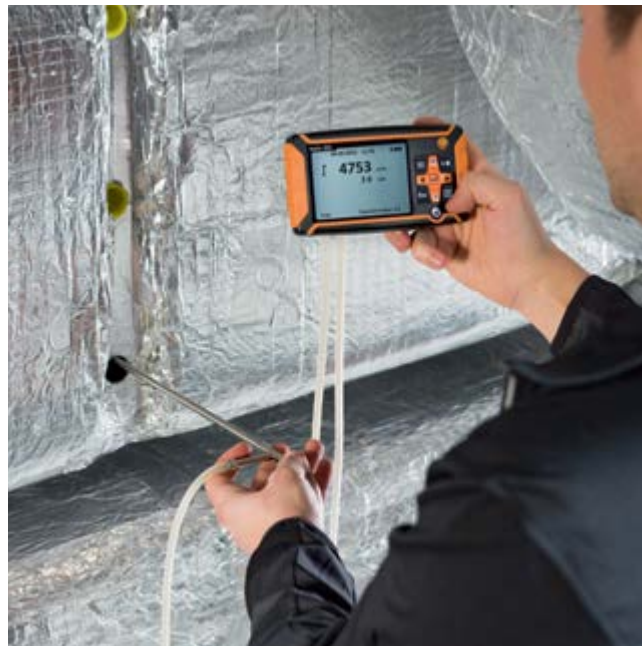
Abnehmbares Gerät ermöglicht Staurohrmessungen im Kanal (Staurohr separat erhältlich)

1980 0411 15/cw/A/03.2015 Änderungen, auch technischer Art, vorbehalten. Alle Preise netto, zuzüglich Versandkosten und MwSt., gültig ab 1.1.2015. Zahlung innerhalb 30 Tage netto.