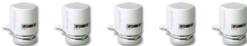
Thermoantriebe MT4-230-NC (pro Zone 3 Antriebe möglich)